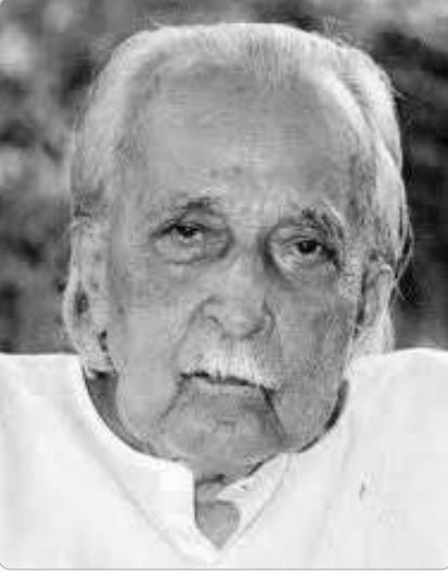
కోట శివరామకరంత్ (1902 - 1997)