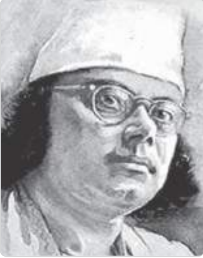
కాజీ నజ్రుల్ ఇస్లాం ( 1899 - 1976 )