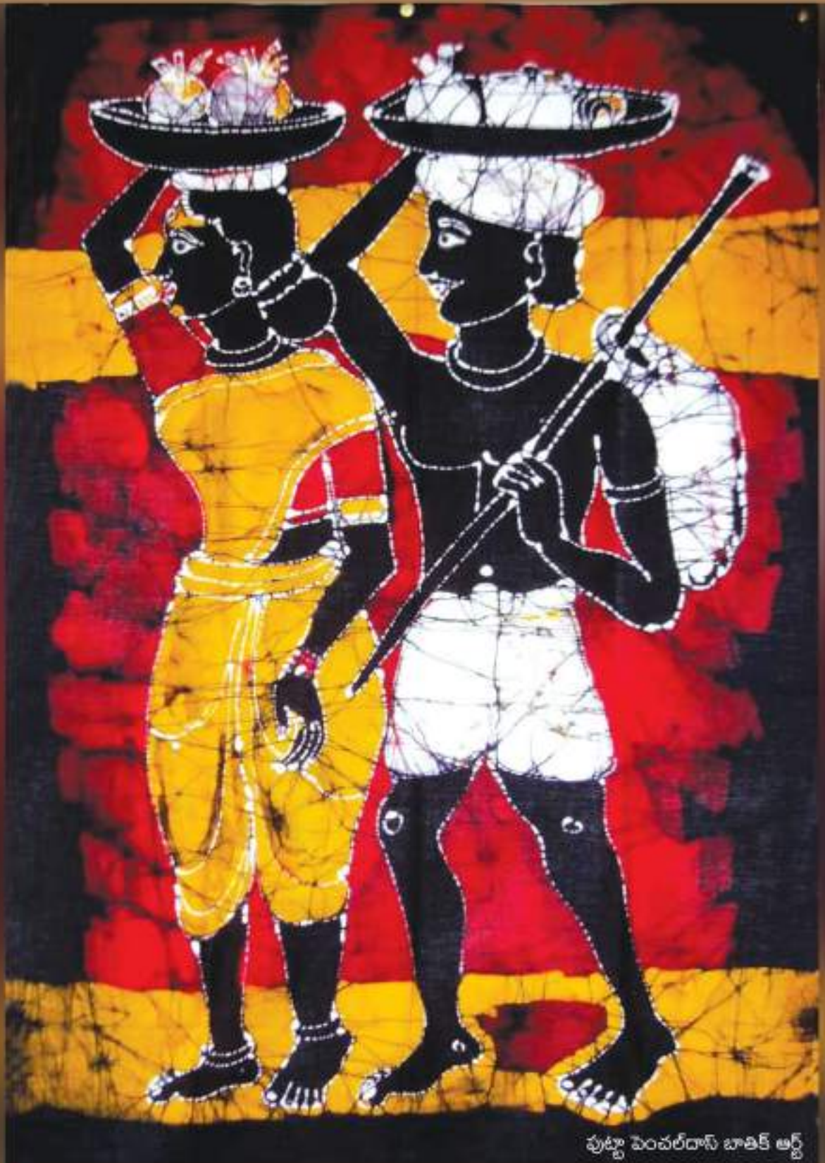
పుట్టా పెంచలేదాస్ బాతిక్ ఆర్ట్

ప్రజాసాహితి 30-7-6, అనపర్తివారి వీధి, అన్నదాన సమాజం రోడ్డు, దుర్గాఅగ్రహారం, విజయవాడ - 520002.